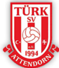
SV Türk Attendorf

Für den SV Türk Attendorf soll es seiner zweiten Bezirksliga-Saison möglichst schnell in ruhige Fahrwasser gehen. Der erneute Klassenerhalt ist das erklärte Ziel in der Hansestadt. Dort zeigte man besonders in der Hinrunde ansprechende Leistungen, ließ dann in der Rückrunde jedoch die Konstanz vermissen, fuhr nur vier Siege ein und musste zwischenzeitlich ernsthaft gegen den Abstieg kämpfen.