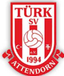
SV Türk Attendorf