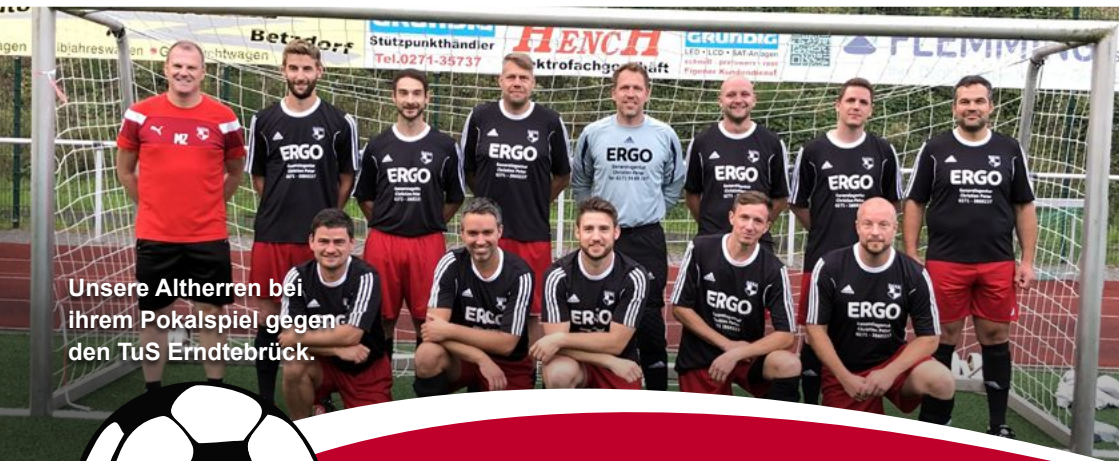
Unsere Altherren bei ihrem Pokalspiel gegen den TuS Erndtebrück.